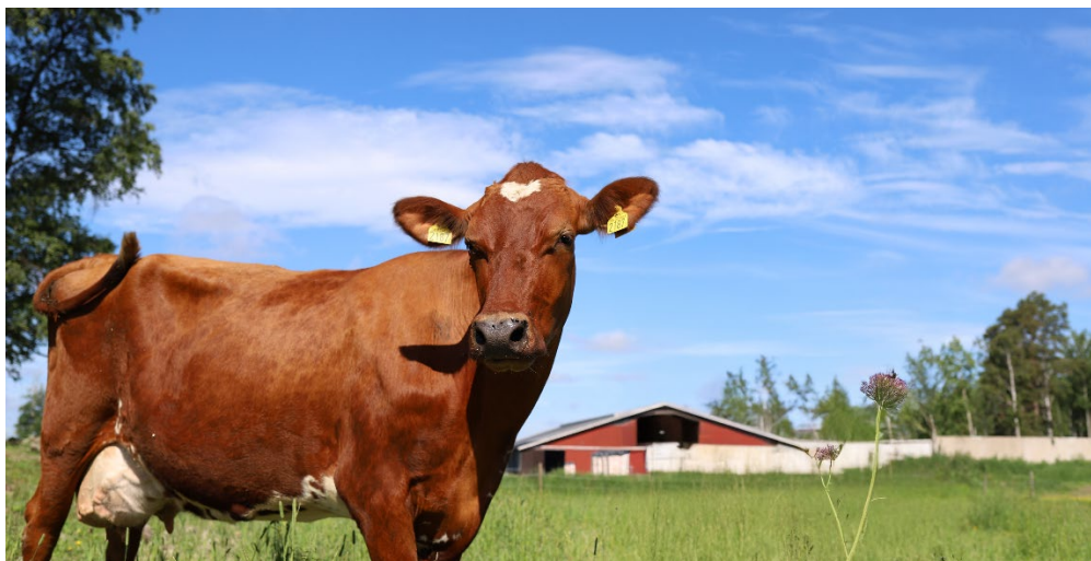
Figur 1. Ko på grönbete.

Programmet lyfter fram vikten av likvärdig service, fungerande infrastruktur och digital uppkoppling, samtidigt som kultur, fritid och föreningsliv är viktiga drivkrafter för gemenskap och attraktivitet. Det sträcker sig till 2035 och ska bidra till regionala och nationella mål för hållbarhet, livsmedelsförsörjning och krisberedskap. Som ett handlingsinriktat verktyg stärker det landsbygdens roll i hela kommunens utveckling och säkerställer att resurser används långsiktigt och hållbart.