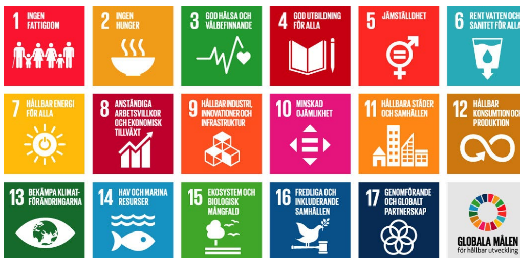
Figur 2. Agenda 2030 – Globala målen för hållbar utveckling.

Agenda 2030 är FN:s globala handlingsplan för hållbar utveckling. Den omfattar 17 mål som bland annat syftar till att avskaffa fattigdom, minska ojämlikheter och möta klimatutmaningen, samtidigt som ekosystem och naturresurser värnas. Syftet är att handlingsplanen ska ligga till grund för att skapa en hållbar utveckling som tillgodoser dagens behov utan att kompromissa framtida generationers möjligheter till hållbar utveckling. Agenda 2030 är vägledande för kommunens arbete och kopplar samman social, ekonomisk och miljömässig hållbarhet i alla delar av samhällsutvecklingen.